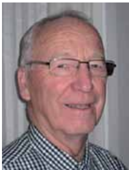
Tor Mathiassen Moflata misjonskirke

Påske er, var og vil i all framtid være det viktigste i våre liv. I min oppvekst var påske en stor høytid.