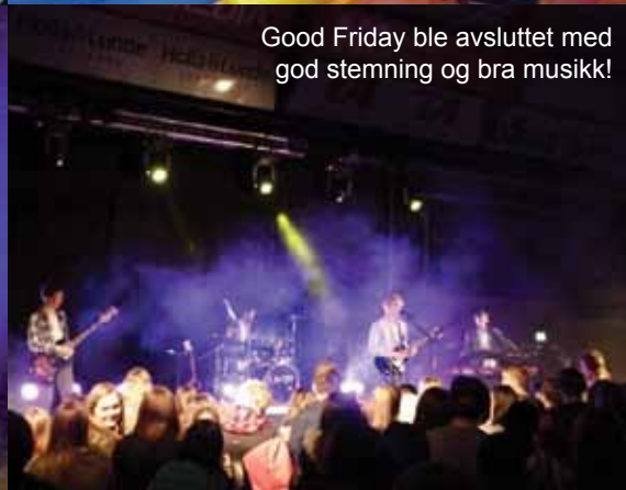
Good Friday ble avsluttet med god stemning og bra musikk!