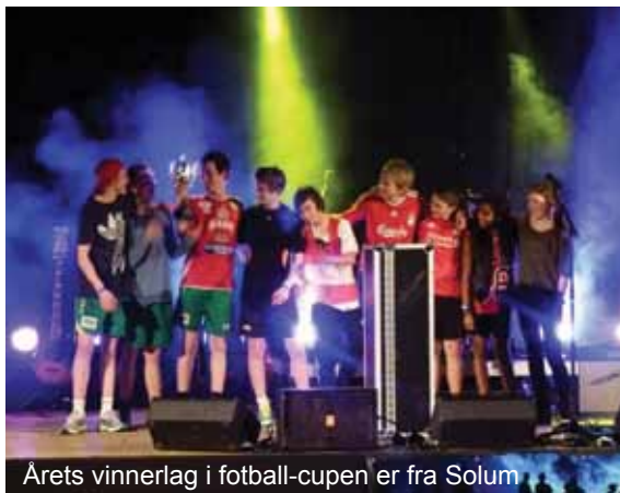
Årets vinnerlag i fotball-cupen er fra Solum