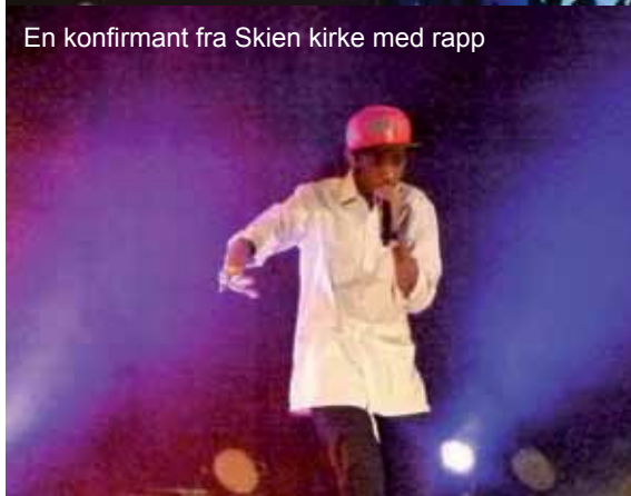
En konfirmant fra Skien kirke med rapp