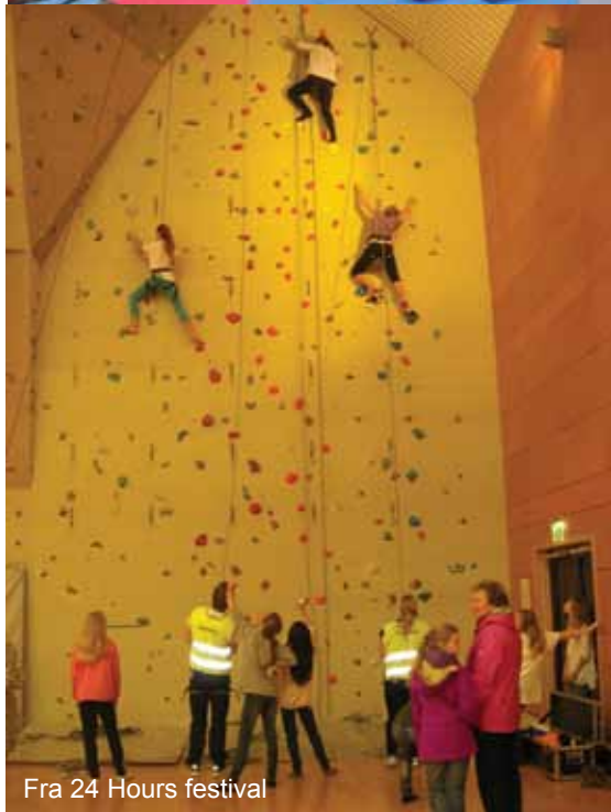
Fra 24 Hours festival