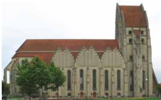
Grundtvigs kirke, Bispebjerg, nordvest i København. Grunnsteinen ble lagt ned på Grundtvigs fødselsdag 8. september 1921. Hele kirken ble ferdig i 1940. Den ble bygd for cirka 1 800 besøkende. Tårnet er 42 meter høyt, og lengden med kor og våpenhus er 70 meter. Kirken er en attraksjon i København, og et besøk verd.