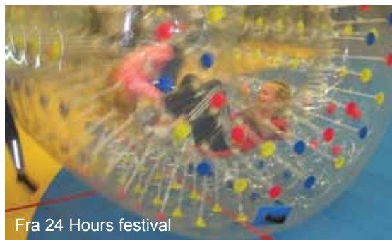
Fra 24 Hours festival