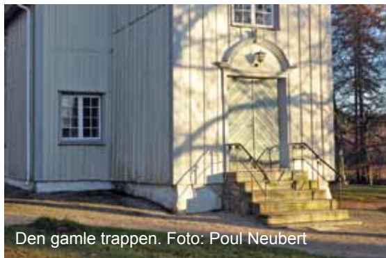
Den gamle trappen.

Alle bidrag, små eller store, mottas med takk.