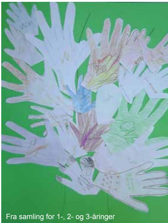
Fra samling for 1-, 2- og 3-åringer

Et annet stort arrangement 30.11 er overnatting i kirka. Alle våre fire menigheter er enige om å arrangere det i Solum kirke i år. Det er i