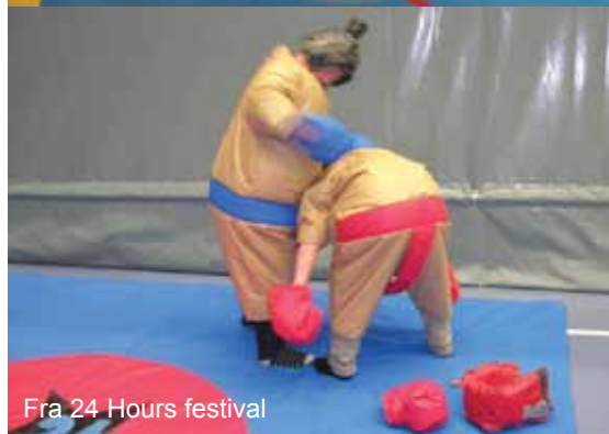
Fra 24 Hours festival