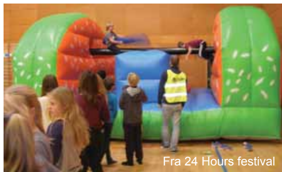
Fra 24 Hours festival