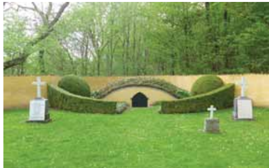
Familiegravstedet der NSF Grundtvig er begravet. Åsen ved Køge.

Min interesse for Grundtvig er vel kanskje først og fremst av personlige grunner. Jeg ble gift i en av Københavns katedraler, nemlig Grundtvigs kirke. Min kone tilhørte sognet og ble døpt og konfirmert i kirken. Ja, kirken har vært til stede i både gleder og sorger for familien, og gir gode minner. Grundtvig var en åndsperson som har satt dype spor i den nordiske kultur. Og nå i juletiden er han særlig aktuell.