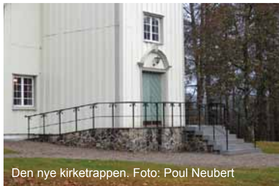
Den nye kirketrappen.

Du kan også gi et bidrag på SMS ved å sende Solum til 2160 (du gir da 100 kroner via telefonregningen din).