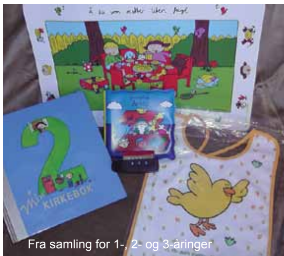
Fra samling for 1-, 2- og 3-åringer